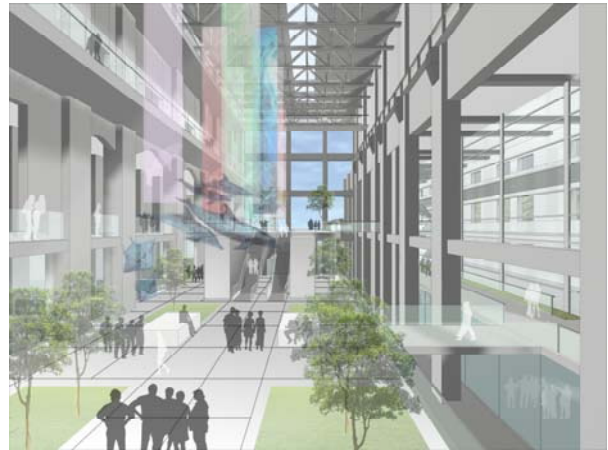
主題館中庭模擬圖