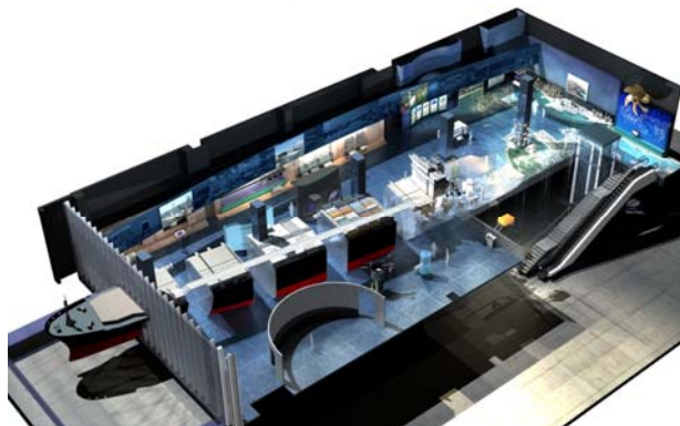
船舶與海洋工程廳模擬圖