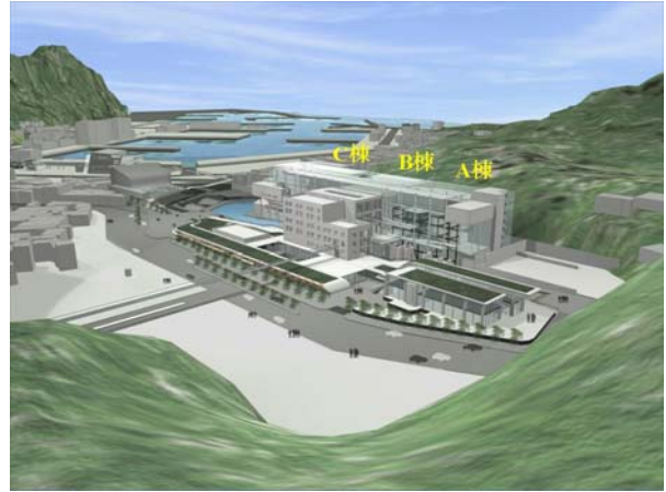
海科館主題館透視圖