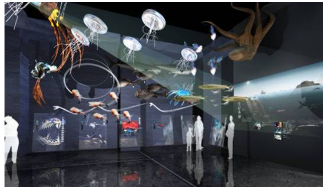
深海展示廳模擬圖