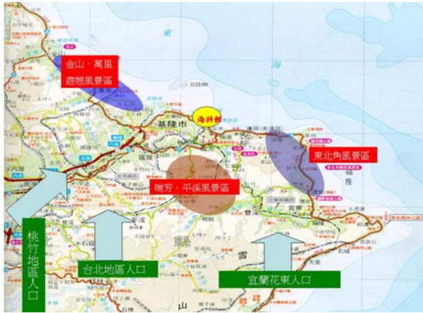
海科館地理位置示意圖