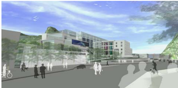
自海洋廣場東眺主題館區模擬圖