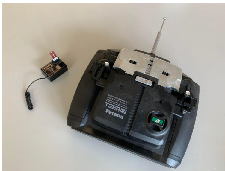
市售 3 通道 27MHz 板型遙控收發器