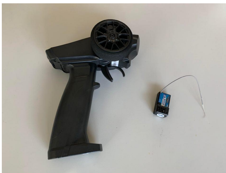
市售 3 通道 2.4GHz 槍型遙控收發器

本競賽禁止使用市售 2 通道、3 通道或多通道之 2.4GHz、27MHz (或其他頻率) 槍型或板型遙控收發器 (或由類似控制元件組合) 作為控制遙控帆船之裝置 (如下二圖所示)，違者以 失格 認定。